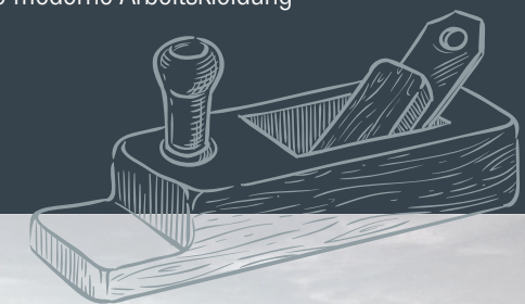
Firmensitz in Mirow